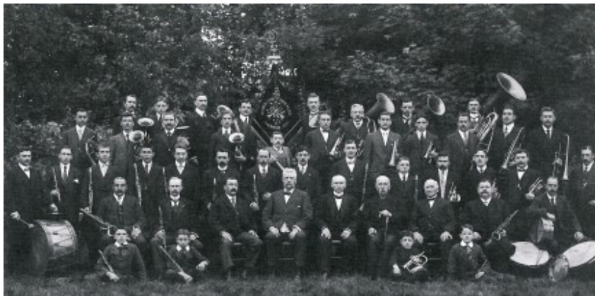
Stadsharmonie KVA circa 1913